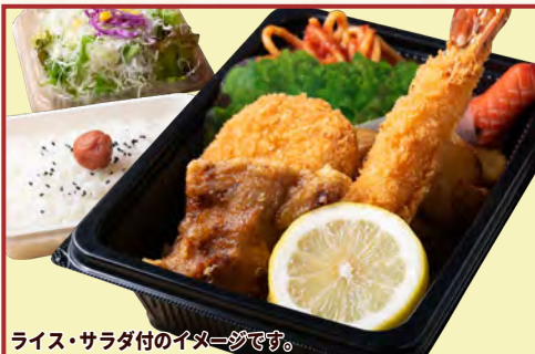
ライス・サラダ付のイメージです。