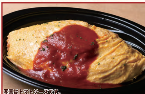
写真はトマトソースです。