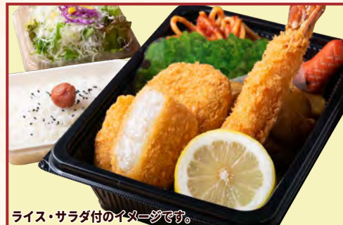
ライス・サラダ付のイメージです。