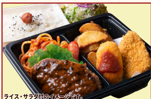
ライス・サラダ付のイメージです。