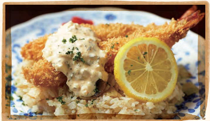
海老フライライス