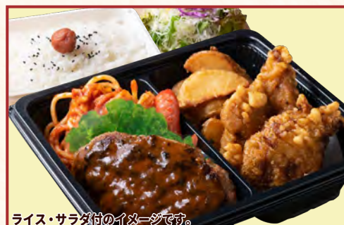
ライス・サラダ付のイメージです。