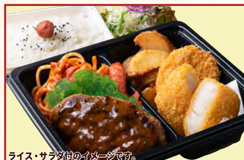
ライス・サラダ付のイメージです。