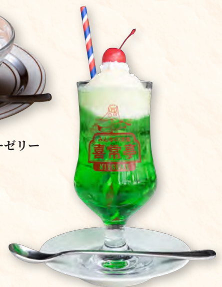
メロンクリームソーダ