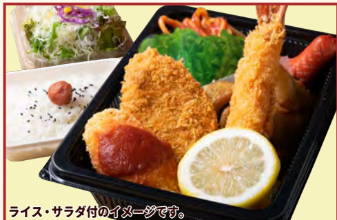
ライス・サラダ付のイメージです。