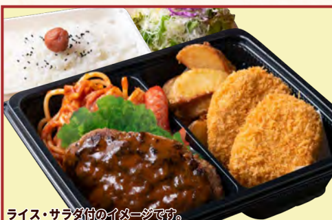
ライス・サラダ付のイメージです。