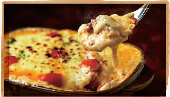
鶏のクリームミートドリア