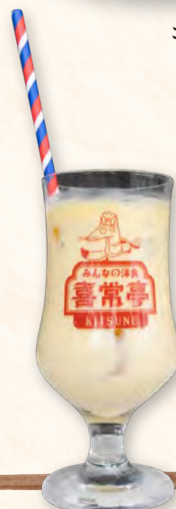
自家製ミックスジュース