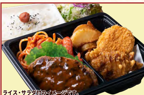
ライス・サラダ付のイメージです。