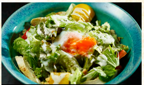
炙りささみのシーザーサラダ 680円 (税込 748円)