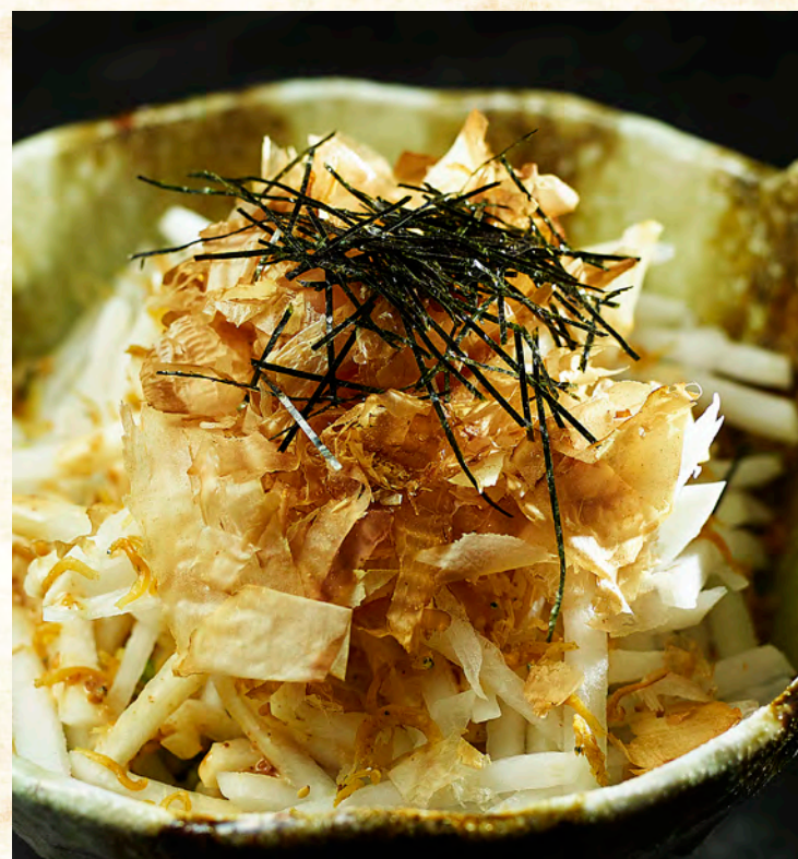
じゃこの大根サラダ 600円 (税込 660円)