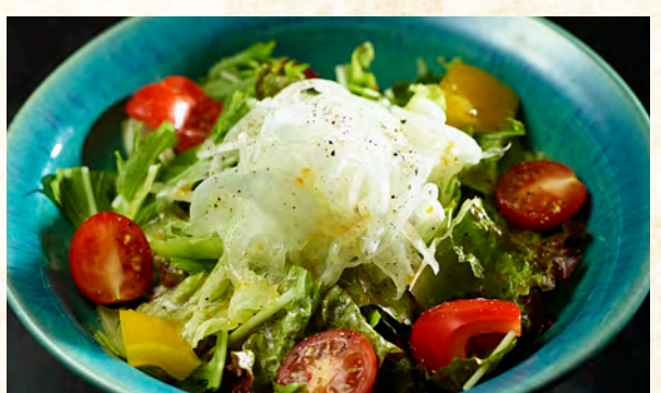
自然の恵み柑橘サラダ 730円 (税込 803円)